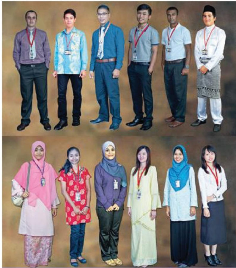
Contoh Penampilan Pakaian Pelajar