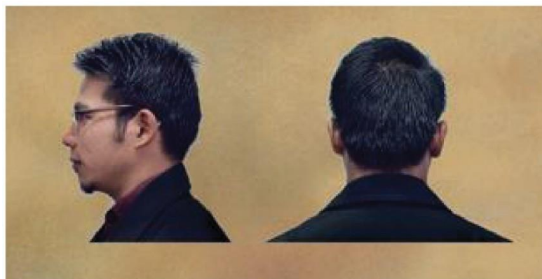
Contoh Penampilan Rambut Pelajar