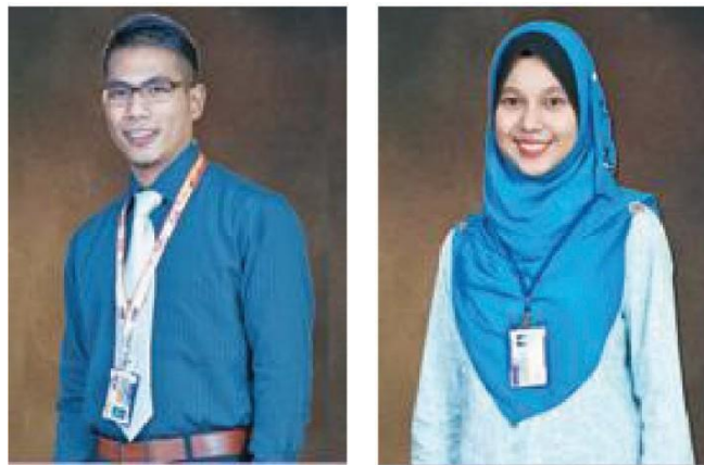
Contoh Penampilan Kad Matrik Pelajar